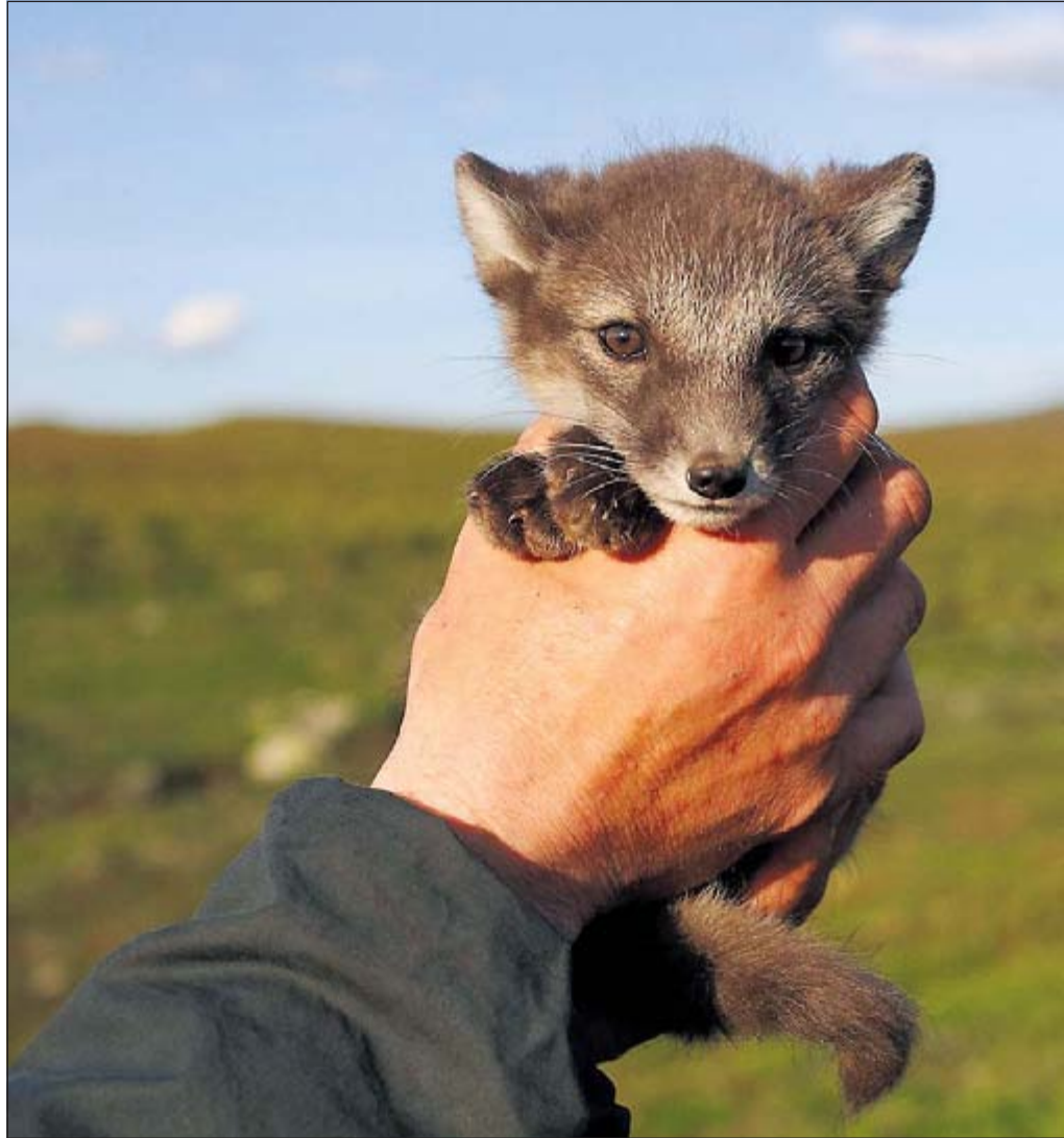
TRENGER HJELP: Fjellrevens skjebne er trolig nå i menneskets hender. Uten hjelp taler mye for at arten vil i feil retning for fjellreven.

Tiltakene som til nå har vært satset på i Norge er avlsprogrammet på Dovre. Med en del oppstartsproblemer har NINA-forskerne i 2008 tilgang på totalt 28 fjellrevvalper. I tillegg hadde de en utsatt tisper som ynglet i det