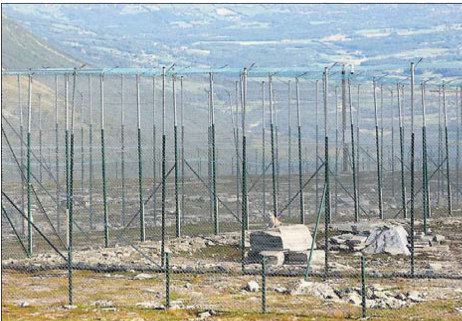
VELLYKKET: Avlsstasjonen på Dovre videreføres. Stasjonen gir mulighet til å styre den genetiske variasjonen og valper kan settes ut hvor som helst. I 2008 lyktes NINA bra ved stasjonen.

Jämtland og Västerbotten län i Sverige hadde i år over 200 overlevende fjellrevvalper i det fri med disse metodene. Et 50-talls rødrever er skutt i hvert län i vinter. På norsk side er man usikker på overlevelsen, men av 8 kull i Børgefjell er trolig ingen igjen etter sommeren grunnet matmangel.